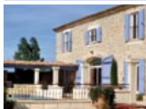
Aide à la recherche