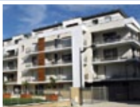
Conseil à l'acquisition