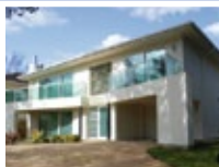
Pack Duo achat/vente

||| CÔTÉ ACHETEUR® L'IMMOBILIER SUR MESURE